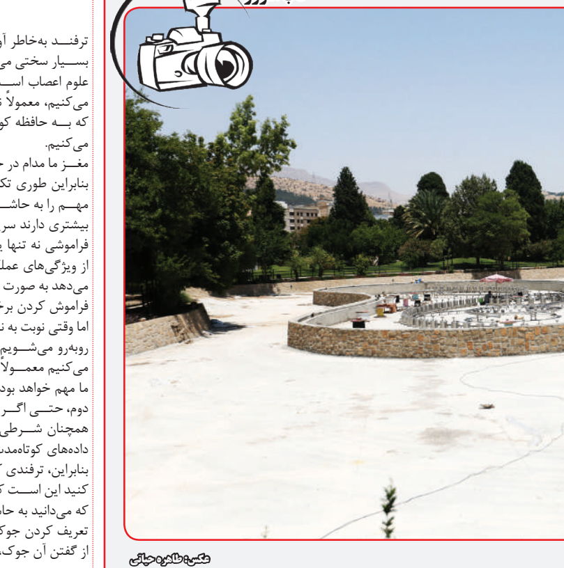
دریاچه آبی بدون آب