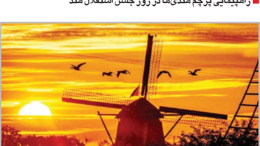
اسیاب بادی - هلند