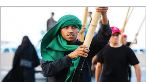
حرکت کاروان پیاده‌روی عشاق‌الحسین (ع) به سمت کربلا - آبادان