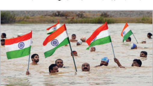
راهپیمایی پرچم‌هندی‌ها در روز جشن استقلال هند