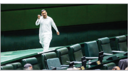
صحن علنی مجلس شورای اسلامی - ۲۴ مرداد