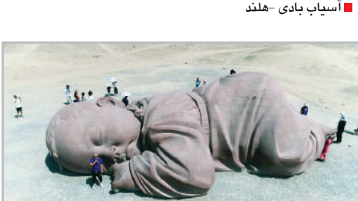
مجسمه پسر زمین - چین